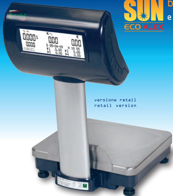
versione retail retail version